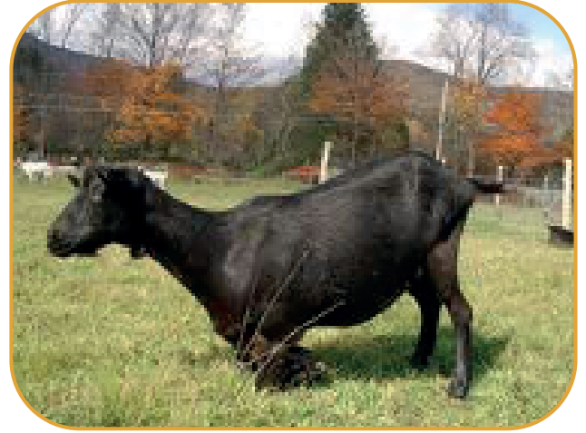
ماعز ذو أظلاف طويلة لايقوى على السير